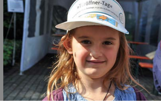
Der Blick hinter die Türen des Wasserwerks ist für Kinder und Eltern spannend